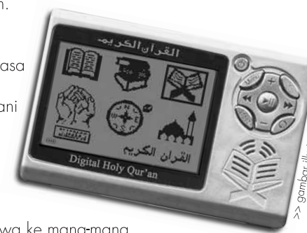
>> gambar ilustrasi sahaja

Sekira berminat memilikinya sila hubungi Zuraidah bt Salleh di talian 016-4021459.